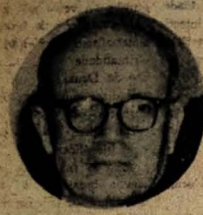
Governador José Américo