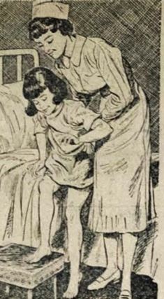
A cirurgia moderna e as novas drogas eliminaram a maioria dos perigos da operação de apendicite. A convalescença é mais segura, mais rápida, mais agradável!

A apendicite não deve atemorizá-lo se for reconhecida e tratada em tempo! Suas consequências sérias são evitadas em quase todos os casos, através de um tratamento oportuno. Mas a apendicite, que é uma inflamação do apêndice (pequeno órgão ligado ao intestino grosso), é sentida às vezes como uma simples dor de estômago. Muitos ignoram a verdadeira doença até que seja tarde demais! Se, aos primeiros sintomas, todos chamassem o médico imediatamente, os casos fatais de apendicite seriam reduzidos à metade!