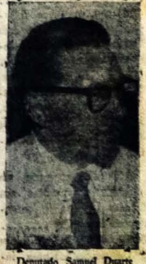
Deputado Samuel Duarte

Regressa hoje ao Rio de Janeiro, após de reassumir suas atividades parlamentares. O nosso ilustre conterraneo deputado Samuel Duarte, ex-presidente da Câmara Federal e elemento de alta proleção nos meios politicos e culturais do País. O parlamentar paraibano viajara as 16 horas de automovel para Recife de onde se transportará à Metrópole da República pelo "Constellation" da PANAIR.