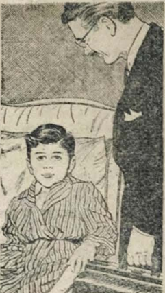
Dor de estômago... ou apendicite? Só o médico poderá dizer! Os maiores perigos da apendicite são: os remédios caseiros e a demora no tratamento.