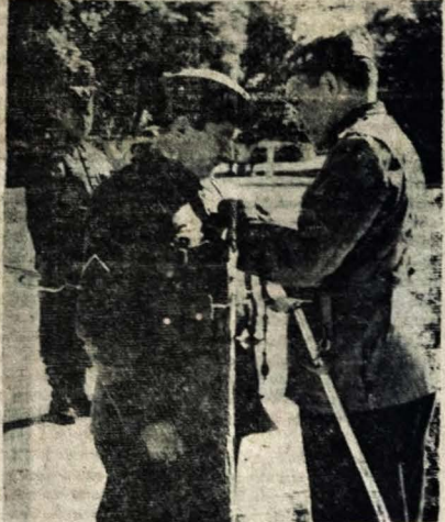
Aduaco Castello Branco, quando acompanhava um dos sargentos do Regimento Vidal de Negreiros, que participou das cerimônias civico-militares do dia 25.

Assinalando-se ontem a data do nascimento do Duque de Caxias, foi comemorado em todo País o Dia do Soldado. Nesta Capital, por iniciativa do cel. Aduaco Castello Branco, Comandante da Guarnição Federal e do 15º Regimento de Infantaria, foi realizado um brilhante programa de solenidades em honra à memória do Duque de Caxias, Patrono do Exercito Nacional. Estiveram presentes autoridades civis e militares, associando-se às festividades do Dia do Soldado. Os flagrantes que estampamos nesta edição refletem algumas fases das comemorações de ontem, na seguinte ordem: 1) — O cel. Aduaco Castello Branco, Comandante do 15º R.I., tendo ao lado o representante do governador José Americo, tenente-coronel Manuel Ramalho, assistente militar de S. Excia. e oficiais da Guarnição Federal; 2) — Desfile do 15º Regimento de Infantaria em homenagem às autoridades; 3) — O cel.