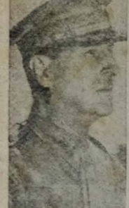
Gen. MAC ARTHUR do ano pelos governadores de 48 estados norte-americanos...

NOVA YORK, 27 (U.P.) — O general Mac Arthur foi eleito por maioria do "homem