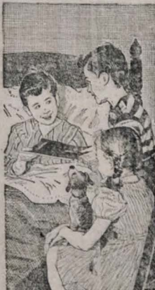
Novos remédios, administrados pelo seu médico, podem salvar 5 de cada 10 doentes de pneumonia!