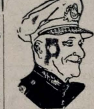
GENERAL ESTILAC LEAL