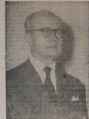
GOVERNADOR JOSÉ AMÉRICO