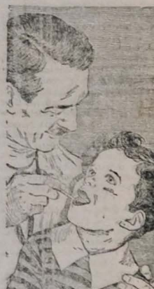
Quando tiver um resfriado forte, ou logo ao médico!

P. O que há de novo no tratamento da pneumonia?