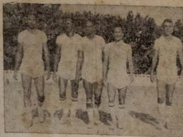
O quinteto atacante do "Botafogo" para o prelo de hoje

Será realizado na tarde de hoje, no estadio do Cabo Branco, o choque amistoso com o qual o AUTO ESPORTE e o BOTAFOGO, fechando a temporada de ouro a temporada pebolística de 1951. Estabelecimentos e automobilistas despendem-se de seus torcedores neste fim de ano, prometendo realizar uma exibição que superará todas as demais já verificadas entre os dois destacados conjuntos peenses, porque ambos se acham empenhados em lutar com o maximo de seus esforcos, em poder proporcionar ao numero publico que afluirá ao local do encontro, uma peleta arduamente disputada, cheia de lances técnicos empolgantes e lances sensacionalis.