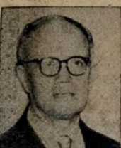
Governador José Américo a grandeza da terra comum. Não teve Vossa Excelência somente a preocupação de

tos de boas vindas e o nosso espontâneo e leal apoio às justas manifestações de regozijo com que o altivo povo parabaense festeja o regresso de Vossa Excelência da Metrópole da Fé, onde, com grande civismo, defendeu com todo o ardor patriótico, dedicação, persistência e amor parabaense, os magnos e inadiáveis problemas do nosso Estado. A Paraíba exulta de encontrada alegria e reconhecimento diante desse acontecimento porque acompanhou com inconfundível entusiasmo, todas as demarches por Vossa Excelência encetadas em relação ao encaminhamento e execução de vários problemas de máxima importância à vida econômica de nossa região. A permanência de Vossa Excelência na Capital Federal não constitui a viagem de tercio, como aconteceu em governos passados. Foi a ausência de dois meses, em cujo período os vitais problemas da Paraíba, tomaram-lhe todo precioso tempo, num afan constante, num esforço dinâmico e eficiente com a preocupação de fazer tudo pe-