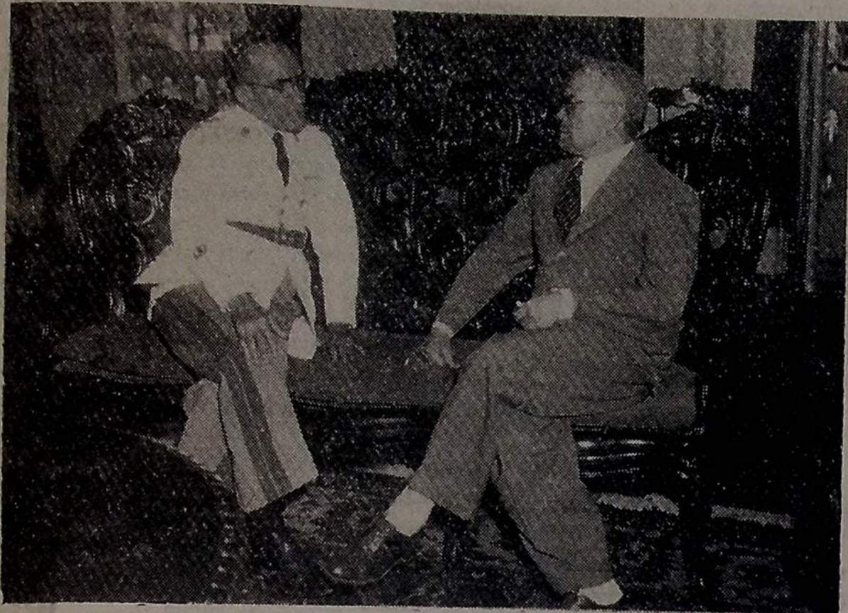
Em visita de cortezia ao governador José Américo de Almeida, esteve, ontem, no Palácio da Redenção, o cel. Adauto Castelo Branco, comandante da Guarnição Federal neste Estado. O ilustre militar foi recebido no salão nobre do Palácio do Governo, ali se demorando em cordial palestra com o Chefe do Executivo. A foto acima fixa um flagrante da entrevista que aquela alta autoridade do Exército manteve com o primeiro magistrado paraibano

A tese que o Brasil defenderá na Conferencia de Washington — Apresentarão memoriais as Confederações da Industria e Comercio — Viará para os Estados Unidos o ministro Estilac Leal