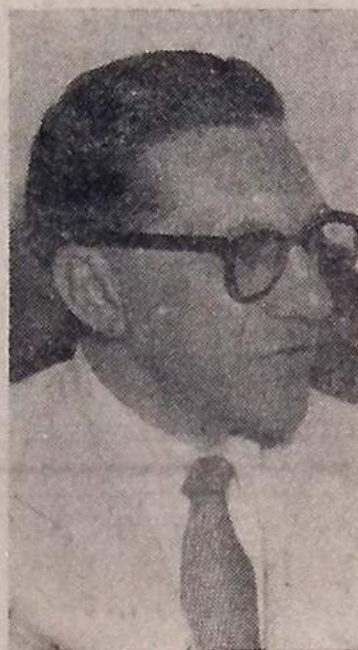
Deputado Samuel Duarte

representa a Paraíba, tendo ocupado a presidência daquela Casa do Congresso em dois períodos legislativos.