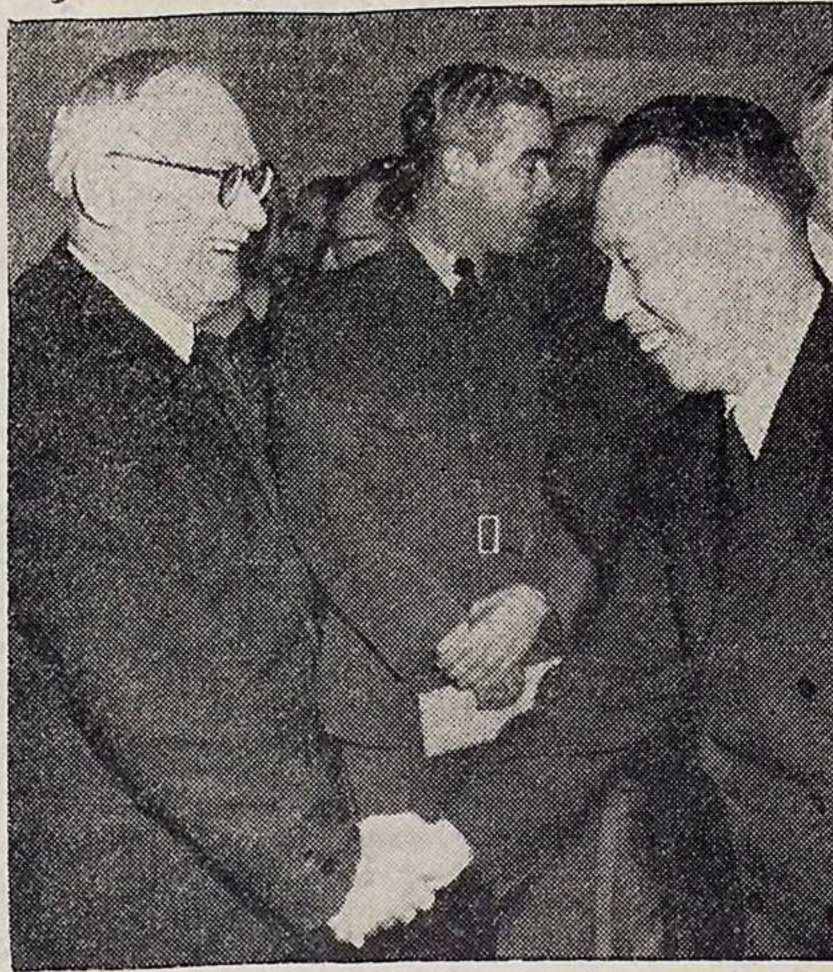
Em Lake Success, Andrei Vishinsky é cumprimentado pelo representante da China comunista, depois de tentar inutilmente, convencer as nações livres das «razões» da agressão comunista á Coreia.

Durante sua estada nos Estados Unidos, o sr. Reuter se entrevistará com diversas autoridades, especialmente com o Secretario de Estado, com quem examinará a situação da antiga capital alemã e suas relações com os russos.