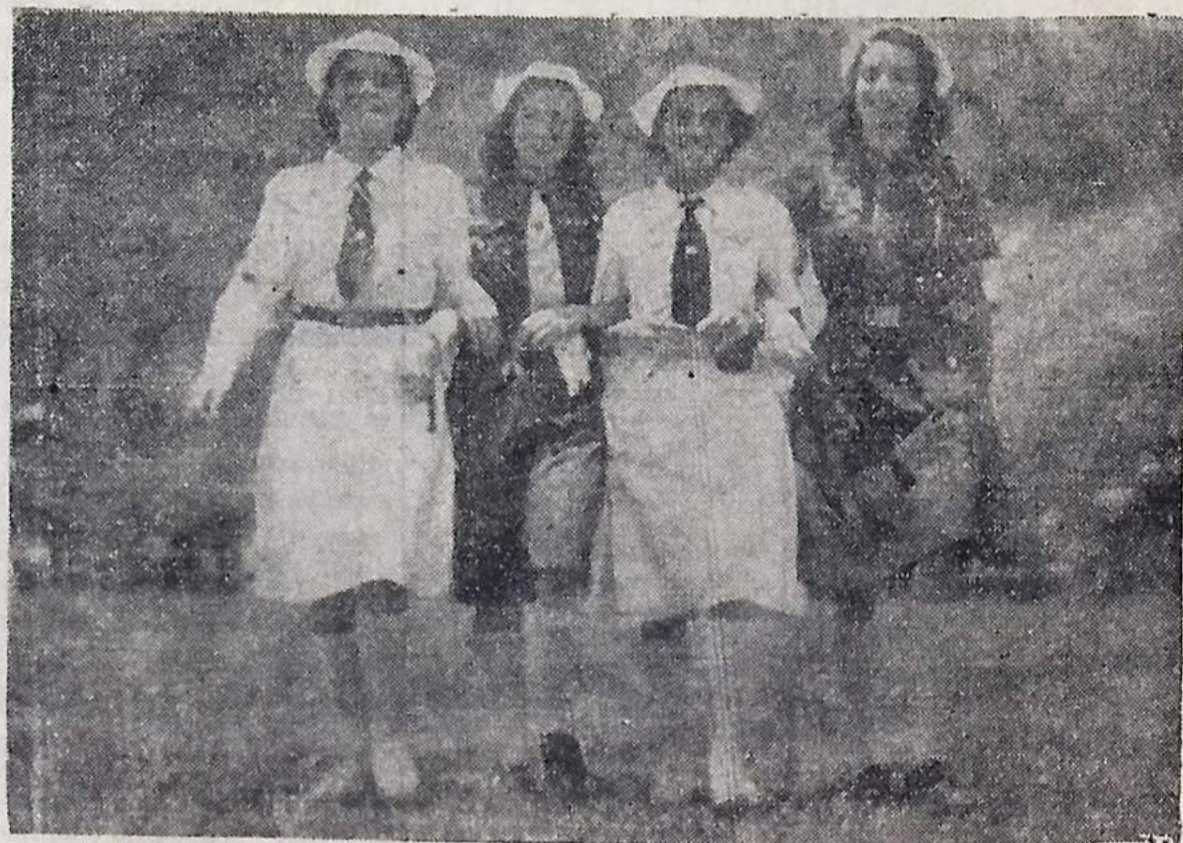
Algumas das componentes do grupo de Bandeirantes que chegará, hoje, a João Pessoa

Programa de recepção organizado pelo Governo do Estado e Prefeitura de João Pessoa — O sorvete dançante de hoje, às 20 horas, na sede de campo do Esporte Clube Cabo Branco — Visita aos pontos pitorescos da cidade — Notas