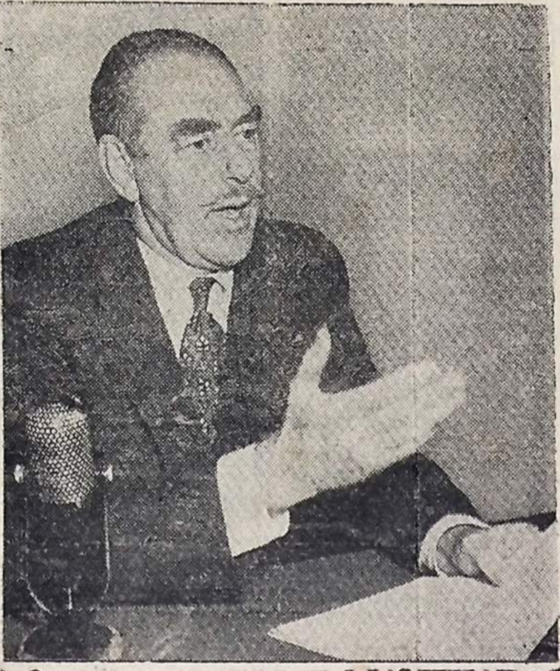
Fotografia feita quando o Sr. Dean Acheson, Secretário de Estado Norte-americano, falava ao povo dos Estados Unidos através do rádio e da televisão, diretamente de seu escritório em Washington. No seu discurso o Secretário Acheson acusou a China comunista de agressão não-provocada que vinha criar uma nova crise e uma situação de perigo sem paralelo.

RECIFE, 5 (Meridional) — A bordo do navio "Mongala" encontram-se três camelos destinados ao zoo do Rio de Janeiro. Um deles está doente, tomando penicilina e sob rigorosa dieta.