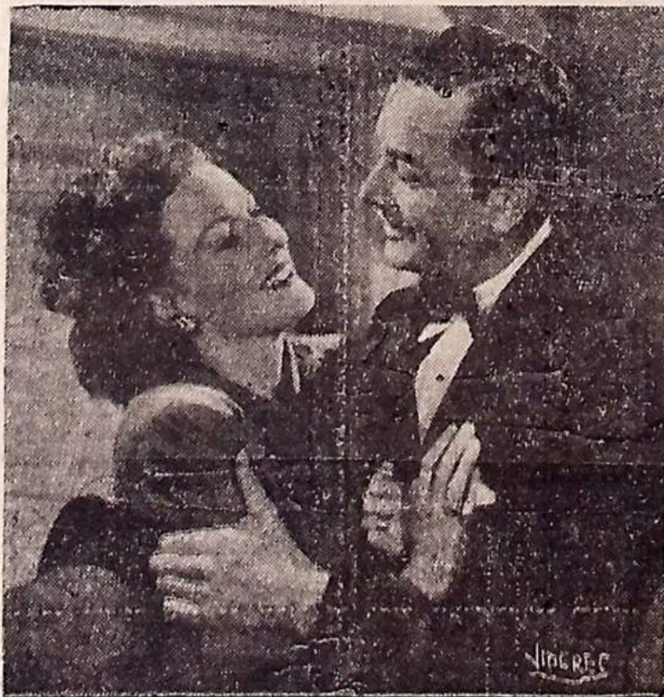
Uma cena de «AMA SECA POR ACASO»

Anunciou nos jornais e por fim encontrou a ama tão procurada... Mas vejamos: a ama era um cavalheiro de modos recatados, um excêntrico papel vivio por Clifton Webb.