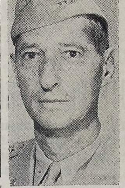
General Mark W. Clark, chefe das Forças de Terra dos Estados Unidos, desde Outubro de 1949. O General Clark comandou os vitoriosos Exércitos Aliados no Norte da Africa e na Itália, durante a Segunda Guerra Mundial. Em 1945 foi nomeado Comandante Chefe das Forças de Ocupação na Austria e Alto Comissário dos Estados Unidos. Em 1947 foi posto a cargo do Sexto Exército dos Estados Unidos, com quartel-general em São Francisco da California.

Provocações comunistas em Amsterdam e Haya — Intervenção policial para dispersar a multidão — Importantes declarações á imprensa holandesa