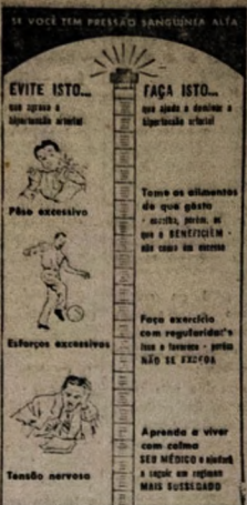
Você e seu médico - em colaboração - podem evitar que a hipertensão arterial perturbe a sua vida.