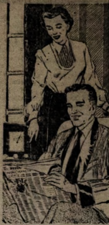
Uma das melhores maneiras de ajudar a diminuir a pressão sanguínea está a seguir um regime de vida moderado.

SE VOCÊ PASSA DOS 40 - Inga examinar sua pressão sanguínea regularmente. A hipertensão arterial é mais frequente entre as pessoas de meia idade ou de idade avançada - mas um exame físico cada ano pode descobri-la no começo. Consulte o médico, se sofre com frequência de dor de cabeça, náuseas, dispnéia, cansaço, pois são sintomas de hipertensão arterial - apesar de poderem provir também de outras causas. Mas só o seu médico pode dizer. Só ele possui os meios para fazer o diagnóstico e recetar um tratamento adequado.