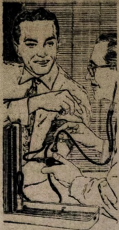
Um exame médico poderá ajudá-lo a descobrir a pressão arterial alta em tempo - quando é mais fácil combatê-la.