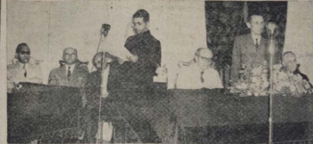
FLAGRANTE APANHADO ONTEM, NA ACADEMIA PARAIBANA DE LETRAS

Compareceram o governador José Americo de Almeida e outras figuras da maior expressão dos círculos intelectuais