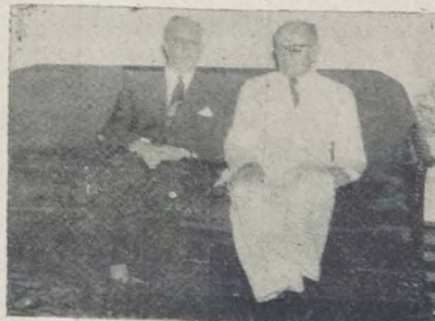
Flagrante colhido num dos salões do Palácio da Redenção, vendo-se o governador José Américo de Almeida e o Ministro Souza Lima.

A referida seita de fanáticos é responsável pelo assassinato de vários membros do Governo inclusive o "premier" general Razmfar. A dita organização terrorista é a mais poderosa do país.