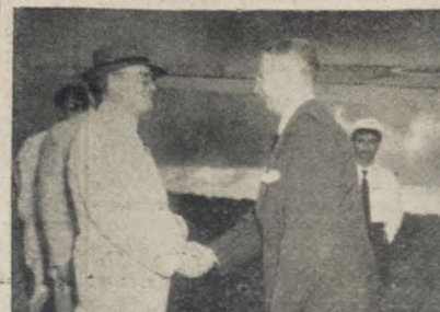
Flagrante tomada, ontem, à chegada do titular da Viação à Paraíba, vendendo ao governador José Americo quando recebia o Ministro Souza Lima, no aeroporto de Santa Rita. (Texto na 3ª página).

SAO PAULO, 14 (M) — O Departamento da Ordem Política e Social distribuiu um comunicado à imprensa visando alertar a juventude estudantil de São Paulo sobre o que designa plano de mistificação russo-sovietica o festival brasileiro da Juventude, acrescentando que a União Internacional de Estudantes e a Federação Mundial da Juventude Democrática são órgãos estudantis da Komsovol, entidade dirigida pela juventude comunista russa, que controla essa organização a serviço e expansão da Rússia no mundo.