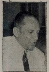
SENADOR RUY CARNEIRO

A homenagem, amanhã, ao eminente paraibano