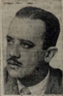
SENADOR EPITACIO PESSOA