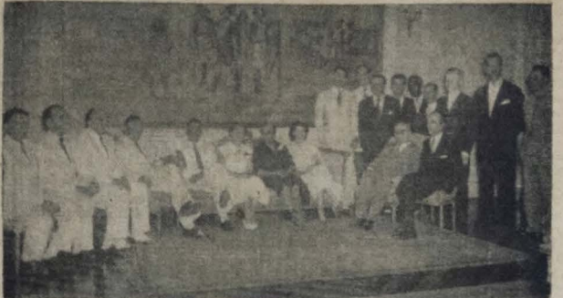
Artistas de rádio e figuras de postos administrativos de emissoras locais, estiveram, ante-ontem, em visita de cortejo ao governador José Americo de Almeida.

Recebidos no salão nobre do Palácio da Redenção, pelo Chefe do Executivo paraibano e esposa, que se achavam, então, acompanhadas de figuras de destaque das esferas administrativas e dos círculos políticos.