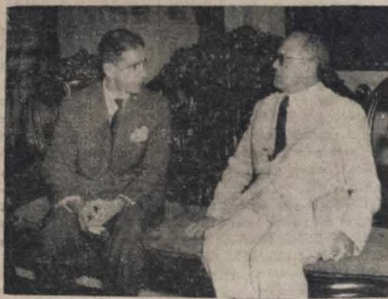
O clichê acima fixa um aspecto da conferência mantida, no Palácio da Redenção, entre o governador José Américo e o dr. Paulo Brício

Na realidade, o que a esfera federal tem procurado executar através do Departamento Nacional de Obras Contra as Secas é apenas prevenir, evitar as consequências dentro das possibilidades que dispõe, muito embora, — sejam francos — a execução deste programa tem sido apenas culminante nos momentos de crises cíclicas que começamos a atravessar atualmente. De maneira alguma a finalidade do D. N. O. C. S. tem sido de caráter curativo. As estradas, regime de adaptação pelo aproveitamento das grandes bacias hidrográficas regionais, adaptação em regime de cooperação com os proprietários das áreas atingidas, regime de aproveitamento das vazantes das zonas irrigadas, etc., são apenas medidas de caráter preventivo. Os serviços de emergência, estes sim, se apresentam cada vez que uma região está assolada pelo flagelo e serve para demonstrar que o