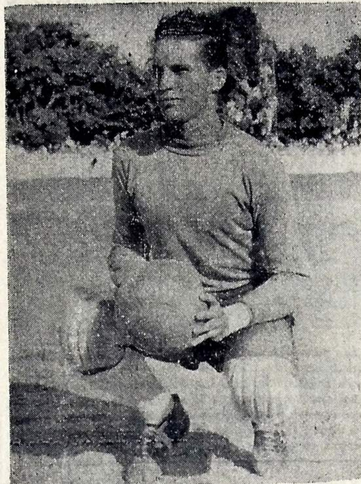
PACIFICO, valoroso guardião do BOTAFOGO

O Santa Cruz, por sua vez, veio disposto para o que de vier. Tendo sido derrotado pelo Botafogo, por 3x1, por ocasião de sua visita a João Pessoa, desta vez, os pernambucanos não