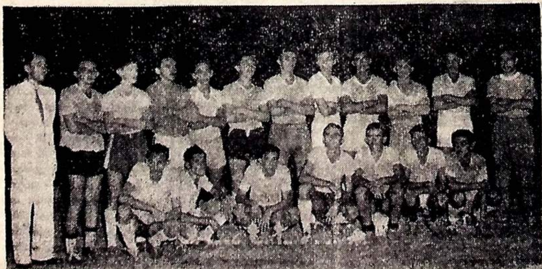
OS RAPAZES DA SELEÇÃO DE AMADORES DA FPF QUE DERRETOU O «ATLETICO» DE SAPE, ONTEM, POR 3x1