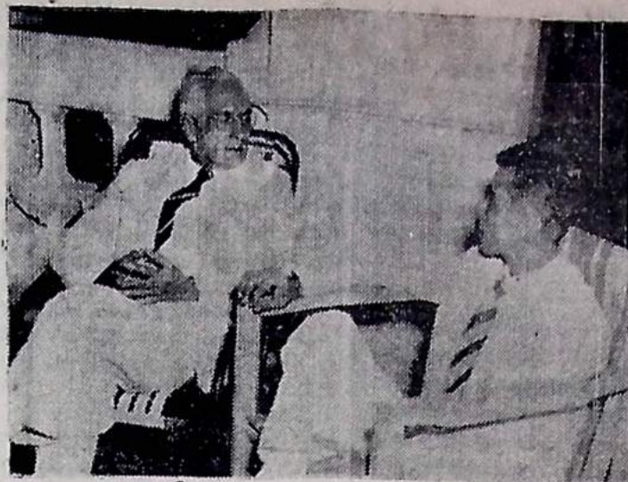
Flagrante colhido por ocasião da entrevista concedida, ontem, à «A União» pelo general José Pessoa, que aparece à esquerda, em palestra com o diretor desta folha

WASHINGTON, 20 (UP) — Novas experiências atômicas estão se realizando atualmente no Atol de Eniwetok, anunciou hoje a Comissão de Energia Atômica.