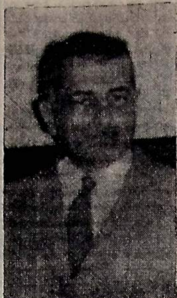
Escritor Gilberto Freyre