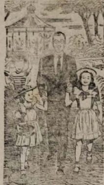
As doenças do coração, tratadas como devem, podem ajudá-lo a viver uma vida longa e ativa.

As doenças do coração estão entre as que causam maior número de mortes! E não precisam ser assim. Os modernos instrumentos médicos como o r-x, a radioscopia e o eletrocardiograma permitem diagnósticos mais rápidos, mais exatos. As novas drogas que hoje existem abreviam infecções e a consequente sobrecarga que estas representam para o coração. E novas complicações, no terreno da cirurgia do coração, podem corrigir defeitos antes irremediáveis. Quem sofre do coração tem hoje perspectivas mais encorajadoras do que nunca.