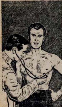
Um exame médico periódico pode ajudá-lo a conservar o coração sempre EM FORMA.