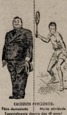
EXCESSOS PERIGOSOS. Péso demasiado. Muita atividade. Especialmente depois dos 40 anos!