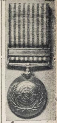
A Medalha das Nações Unidas, que será conferida ao pessoal que serve nas forças de ar, terra e mar das Nações Unidas em operações na Coreia. No verso vê-se o ambiente da organização internacional e no reverso a inscrição "Por serviço na defesa dos princípios da Carta das Nações Unidas". A palavra "Coreia" aparece inscrita na fita de metal que segura a fita. (Foto USIS)

Reduzida atividade TOQUIO, 28 (U.P.) - Um comunicado do Oitavo Exército, publicado hoje, assinala uma reduzidíssima atividade recente. No verso vê-se o ambiente da organização internacional e no reverso a inscrição "Por serviço na defesa dos princípios da Carta das Nações Unidas". A palavra "Coreia" aparece inscrita na fita de metal que segura a fita. (Foto USIS)