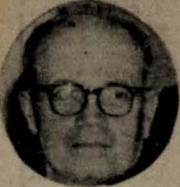
GOV. JOSÉ AMÉRICO DE ALMEIDA

Importante mensagem do Governador do Estado ao Legislativo, encaminhando o projeto de lei alusivo ao vultoso empreendimento — Crédito de 50 milhões de cruzeiros destinado a atender às necessidades de pavimentação da Estrada Central da Paraíba — Ligações João Pessoa-Recife e João Pessoa-Campina Grande, em primeiro plano — O Chefe do Executivo convocará, para tratar do assunto, uma reunião de representantes de classe, imprensa e dirigentes de entidades conservadoras — Criação do Fundo de Pavimentação de Estradas — Acôrdio com o D.N.E.R.