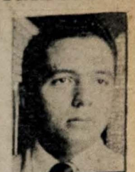
Acadêmicos Romão de Queiroz, nosso companheiro de recên- da e um dos valores do Teatro do Estudante da Para- íba.

O endereço do Teatro de Es- tado é: Rua da República, 100, no bairro de Santa Rosa.