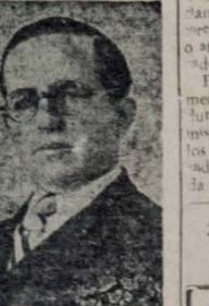
CEL. JURACY MAGALHÃES

da Redenção um administrador capaz, um conhecedor profundo das necessidades do nordeste e, particularmente, da Paraíba e um grande realizador.