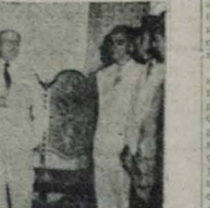
Chegarão, ante-ontem, a esta cidade, os estudantes rio-grandenses do norte, que formam a Embaixada Cultural "Governador José Americo".