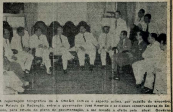
A reportagem fotografica da A UNIAO colheu o aspecto acima, por ocasião do encontro, no Palácio da Redenção, entre o governador José Americo e as classes conservadoras do Estado, para estudo do plano de pavimentação, a ser levado a efeito pelo atual Governo