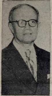
Governador José Américo de Almeida