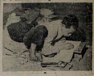
Esse pequeno refúgio, um dos muitos orifícios norte-coreanos ignorados e trabalhos para conservar-se em dia com suas luzes. Vemo-lo estudando em uma barraca, lembranças Abraham Lincoln lendo seus livros à luz da lâmpada.

Os aliados chegaram a 5 kms. de Kumung - A artilharia das Nações Unidas começou a bombardear a cidade - As perdas aliadas segundo a radio de Pequim - Violentos contra-ataques dos comunistas - Forças comunistas frescas são lançadas à luta