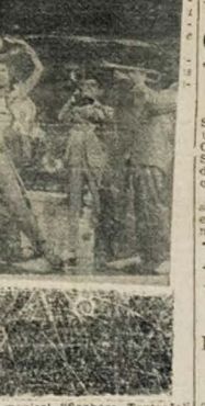
Uma cena do grandioso filme musical "Senhora Tentação" que o REX apresentará hoje em sua tela