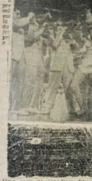
Uma cena do grandioso filme musical "Senhora Tentação" que o REX apresentará hoje em sua tela

Entendam o film mexicano Ninon Seixão, o cinema cubano que admiramos em "Pecadora", e o conjunto brasileiro Os Anjos do Inferno. "SANSÃO E JAILLA" BREVEMENTE NO REX. — O novo espetáculo bíblico de Cecil B. de Mille, "SANSÃO E DALILA", aplaudido em todo o mundo, está bem quebrando