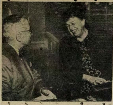
A senhora Eleanor Roosevelt, viúva do antigo Presidente dos EE. UU., dirige-se ao atual Presidente dos EE. UU., o sr. Harry S. Truman na Casa Branca em Washington, D. C. na sua volta à Genebra, Suíça. Ela é a representante estadunidense perante a Comissão para Direitos Humanos das Nações Unidas. Foi presidente da Comissão de 1947-1950.