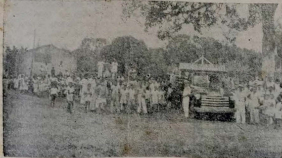
Placante tomado por ocasião da feira da Feira Ambulante ao bairro da Torre

Os gêneros expostos à venda são de primeira qualidade e adquiridos pelos habitantes das