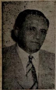
SENADOR RUY CARNEIRO

Sera inaugurado amanhã, o depósito de medicamentos do IPASE, nesta cidade.