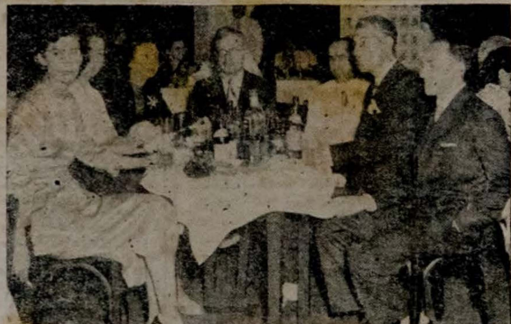
O clichê acima tira um aspecto da elegante recepção oferecida, ontem, no Sport Clube Cabocano, pelo governador José Américo, ao casal Ismael Martinez Sottomayor

HONG KONG, 14 (11 P) — Fontes católicas dizem, serem que mais quatro padres católicos em Shuangi foram presos no dia 6 por motivos não revelados. São eles um padre irlandês, um belga e dois chineses.