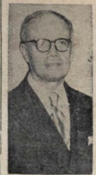
GOVERNADOR JOSE AMERICO

Tendo deixado recentemente a Chefia do Fundo Internacional de Socorro à