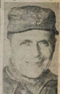
Lt. Gen. Matthew B. Ridgeway ex-Comandante em Chefe do 8º Exército Norte-Americano na Coreia, recentemente nomeado pelo presidente Truman Comandante Supremo das Forças dos Estados Unidos no Extremo Oriente e para o mesmo posto à frente das tropas das Nações Unidas na Coreia, em substituição ao gal. Douglas MacArthur. — MD-2303