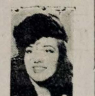
Atriz Lucy Laurour

Está anunciada, para breves dias, a estreia em palco de nossa Capital, a Cia Portatil de