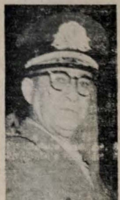
General Americano Freire

Em data de ontem aniversário do general Americano Freire, Comandante da 7ª Região Militar e recentemente designado Embaixador plenipotenciário do Brasil, em Unguia.