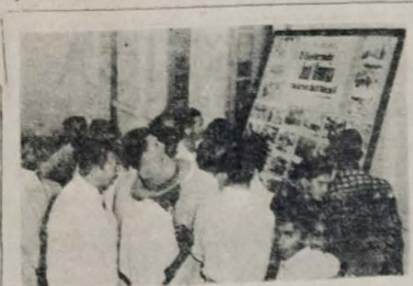
Flagrante colírio, ontem, no Ponto de Cem Reis, por ocasião da aplicação do tradicional "placard" da A UNIAO restaurado pela direção do Departamento de Publicidade. C "placard" afixado naquele importante logradouro apresentava uma reportagem fotográfica completa sobre a recente viagem de observação do governador José Americo à área atingida pela estiagem.