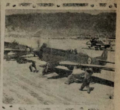
Aviões de combate da Força Aérea da União Sul-Africana se preparam para decolar em um campo na Coreia, afim de cumprir uma missão que lhes foi confiada. (U.S.I.S.)

Esforços iniciais dos comunistas para obrigar um recuo dos aliados — Planejado um desembarque das forças das Nações Unidas na Coreia — Em ação novos "tanks" norte-americanos