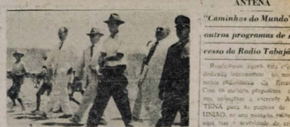
O GOVERNADOR JOSÉ AMÉRICO NA ÁREA DAS SECAS