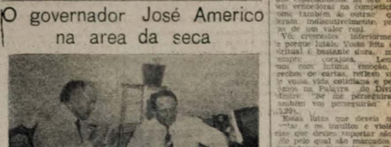
O GOVERNADOR JOSÉ AMÉRICO NA ÁREA DAS SECAS