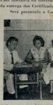
O flarrancie acima foi tomado durante a visita que fizeram a esta folha as senhoritas componentes da Comissão de conclusão do Curso de Professoras de Canto Orfègnico, vindo-se as mesmas prestando declarações, a respeito do aproveitamento conseguido ao cabo de quatro meses de aula.

Realizar-se hoje, em São Paulo, a instalação solene da Reunião dos Reitores das Universidades Brasileiras e diretores de Faculdades Isoladas. A sessão inaugural será presidida pelo ministro da Educação, sr. Simões Filho, e contará com a presença de outras altas autoridades e elementos de destaque dos meios educacionais do país.