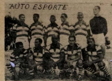
O quadro principal do "Auto Esporte"