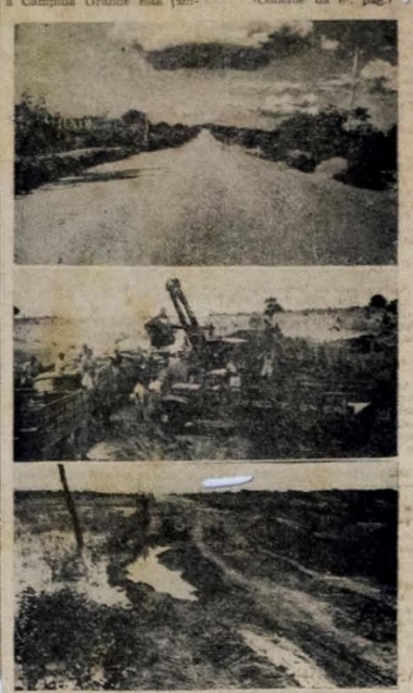
Aspecto dos serviços de revestimento das estradas federais, no vertice parabaiano, vendo-se acima um trecho já revestido, ao centro, parte do equipamento mecânico empregado entre Campina e João Pessoa e em baixo um exemplo de como estavam as rodovias antes das obras ora realizadas.

direta, três milhões, agora os equipamentos que o DNER já possui e que receberá. A partir de Santa Rita até o km 25, será feita apenas serviço de melhoramento, em vista de não serem essas partes aproveitadas pelo empreendimento a cargo do DNER, a iniciar-se breve. Daí a Cajá as obras de revestimento se acham bem adiantadas, enquanto de Cajá a Campina Grande se encontra em fase de planejamento.