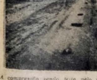
A compressão tendo sido pelo próprio tráfego, por meio de pedras colocadas no leito da estrada, a fim de comprimir as obras de conservação das rodovias federais, pelo DNER.