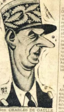
Gen. CHARLES DE GAULLE

Apoio ao Partido Radical e ao Grupo de Independentes — O "premier" Pinay acredita no êxito da estabilidade econômica da França