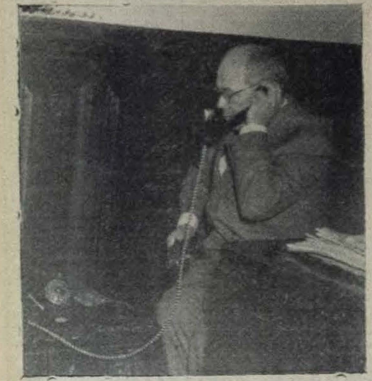
De sua esquerda, do Palácio do Relevo, o Governador José Américo deu o primeiro telefonema da Rádio Internacional, na Paraíba, ligando para Rio e Recife. O rádio é um fragmento do significativo ato, numa foto A UNIAO

Inaugurado, ontem, o Telefone Internacional — O Governador José Américo falou com o Ministro Souza Lima, da Viação, e com o Governador Agamenon Magalhães, diretamente do Palácio — Presenças, ao ato de inauguração, Secretários de Estado e figuras de relevo nos meios administrativos e políticos do Estado