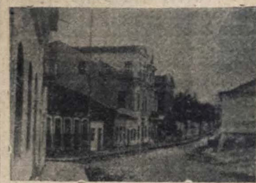
RUA DA AREIA DE 1900 — Aspecto da Cidade Baixa, nos princípios do século. A foto mostra a rua da Areia com seus sobrados de varanda e azulejo, ao lado da casa menor, compondo o quadro urbano em que se apresentam as relações sociológicas do homem de sobrado com o da casa térrea, sem área de nobreza ou mando.