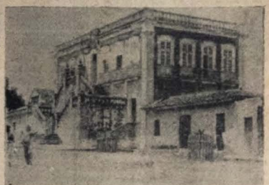
Edifício da Delegacia Fiscal, em 1919 — Prédio construído para a antiga Procuradoria da Fazenda, no século XVIII, passando por reforma, e onde se vê a rua beirada de cimento, ainda existente o longo beirão característico do estilo baiano épico. Vê-se ainda, a Curia Portuguesa, talhada em pedra 165.