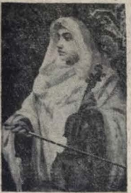
RABEQUISTA ÁRABE — Pedro Américo

Desde de segunda-feira que o Museu do Estado de Pernambuco acolhe com mil e um