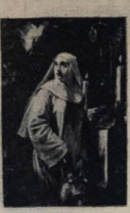
O VOTO DE HELOISA — Pedro Américo

fronta os quadros, servindo-se das muletas de um catálogo sumário. E antes uma aula ao vivo, uma síntese de toda a pintura brasileira.