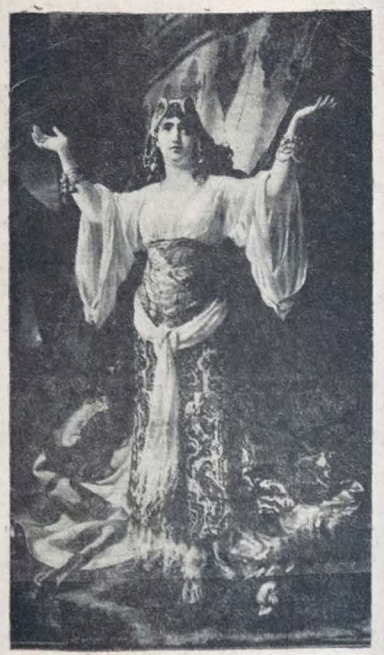
Quadro de Pedro Américo que faz parte da exposição a se realizar, nesta Capital, a partir de 4 de setembro. Uma das grandes telas do paraibano.