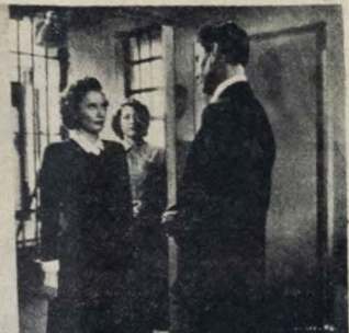
"A CONFISSÃO DE THELMA"

predileto e ajudado por um elenco constituído de artistas de projeção. Produção de Hal B. Wallis e argumento de Kell Frigs. É mais um filme comemorativo do mês de aniversário do Cine Rex.