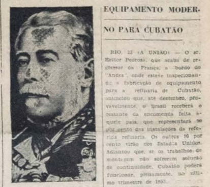
Duque de Caxias