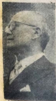
Tendo tomado conhecimento, domingo pela ma-

Com o fim especial de assistir aos funerais do Governador Agamenon Magalhães — Fez-se acompanhar de todo o secretariado, próceres políticos e figuras representativas do nosso meio social