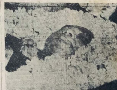
EM CÂMARA ardente, no Palácio do Campo das Princesas, o corpo do Governador Agamenon Magalhães. Foi visitado por destacadas figuras do alto mundo político nacional, autoridades, classes conservadoras, trabalhadores e o povo em geral. A notícia do desaparecimento do Primeiro Magistrado de Pernambuco despertou viva consternação em todos os círculos sociais. A foto acima foi colhida pela reportagem histórica de A UNIÃO, ontem.