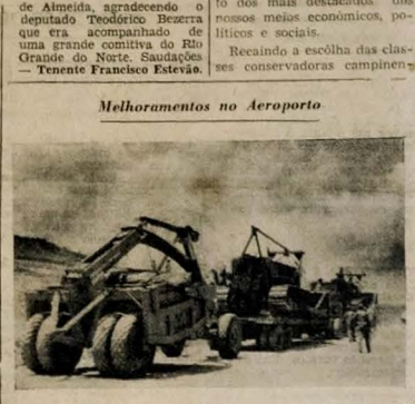
Melhoramentos no Aeroporto

Em João Pessoa foi o ilustre homem público alvo de significativas demonstrações de apreço por parte dos seus amigos e admiradores, tendo sido oportunamente, ainda, de visitar pontos pitorescos desta Capital.