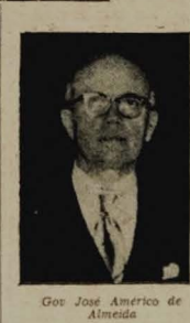
Gov. José Américo de Almeida

Assistirá a solenidade de lançamento da pedra fundamental da estação de passageiros, do aeroporto campinense — Inspeção à obras públicas