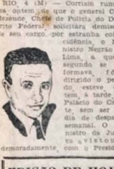
General Cirio de Rezende

Rumores a respeito sobre a atitude do Chefe de Polícia — Vinju ao Minas, o Ministro Negro de Lima