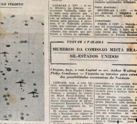
Oficiais e alunos da Escola de Paraquedistas do Exército realizam, no próximo domingo, pela manhã, a primeira demonstração de saltos, nesta Capital. Pelo que possui de inédito, essa demonstração será despertando o entusiasmo da população. No clichê acima, um aspecto de saltos de paraquedismo, pelos alunos da Escola de Paraquedistas do Exército. Será como este da gravura o espetáculo que teremos ocasião de ver, no domingo próximo. (Texto na terceira página)