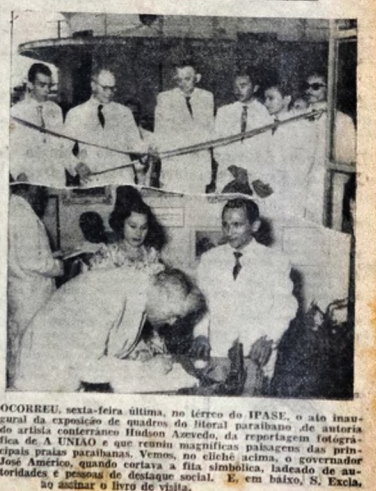
OCORREU, sexta-feira última, no terreço do IPASE, o ato inaugural da exposição de quadros do litoral paraibano de autoria da Fe. A UNIAO e que remiu magníficas paisagens das principais praias paraibanas. ...