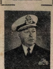
Min. Renato Guilhot

RIO, 13 (M) — O Presidente da República sancionou o Orçamento Geral da União para 1953, acatando os termos do projeto votado no Congresso Nacional. A previsão é de 24.295.230 mil cruzeiros e a estimativa da despesa é de 24.004.956.741 cruzeiros. A renda ordinária no total é de 1.800.473 mil cruzeiros, inclusive 26.144.580 mil cruzeiros da renda tributária; 360.250 mil cruzeiros de rendas patrimoniais; 1.221.246 mil cruzeiros de rendas industriais e 2.784.284 mil cruzeiros de diversas rendas. A receita extraordinária é criada em 2.604.750 mil cruzeiros. A despesa extraordinária destina-se para os diversos ministérios, na seguinte forma: Administração, 2.430.737 mil cruzeiros; Agricultura, 1.764.697.412 mil cruzeiros; Educação, 3.374.077.410 mil cruzeiros; Fazenda, 5.126.927 mil cruzeiros; Guerra, 4.275.128 mil cruzeiros; Justiça, 1.488.379.819 mil cruzeiros; Marinha, 2.713.772.802 mil cruzeiros; Relações Exteriores, 2.532.054.401 mil cruzeiros; Trabalho, 1.032.832.180 mil cruzeiros; Viagem e Obras Públicas, 11.487.600 mil cruzeiros. Em