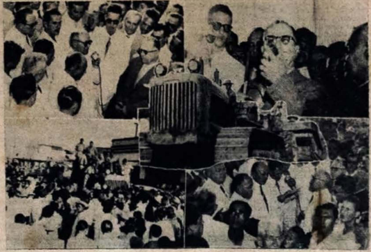
AS FOTOS acima mostram vários aspectos do auspicioso acontecimento ocorrido no domingo último, quando se iniciaram os trabalhos de pavimentação da rod. via Santa Rita-Campina Grande. Ao alto, da esquerda para a direita, o arcebispo e Governador José Américo, quando desfilava, e o deputado Eivaldo Lodi, usando da poltrona. Em baixo, na mesma ordem, grande massa popular aglomerada diante das possantes máquinas utilizadas nas obras, e o engenheiro Paulo Cassandré, no momento em que pronuncia o seu discurso. Em destaque, vê-se uma das máquinas gigantes, empregadas para abrir o trabalho do solo. empreendimento.

Ante-ontem, em Santa Rita — A recepção ao Governador José Américo e comitiva — O aspecto festivo da cidade — Inúmeras faixas alusivas ao acontecimento — O desfile das máquinas pesadas, após as solenidades, na Praça — O povo que vir de perto o início das obras, que se estimam em 136 milhões de cruzeiros — Campina Grande-João Pessoa numa hora e dez minutos — A economia de combustível e de material rodante — Arrojadia obra de arte à saída de Santa Rita — A ligação dos nossos centros consumidores e produtores — Vamos vencer mais uma etapa da recuperação econômica paraibana — Notas