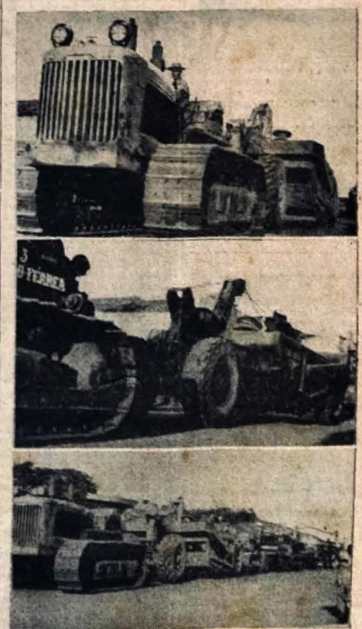
ENSA e uma parte da maquinaria já em atividade a partir da estação 139 do trecho Santa Rita-Campina Grande, local onde o Governador iniciou os serviços de terraplanagem. As máquinas pesadas desfilaram pelas ruas daquela cidade, prendendo a atenção da massa popular. Em seguida, entraram em ação