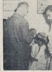
Rememorando as velhas áreas do Itapua, os cinco personagens cívicos dessa amena periferiação, têm e ouvem conta do tempo dos bangas. Do Sr. Maria Menina, ícone do romancista José Lins do Rêgo, abre as portas da usina açucareira de casa de açúcar