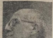
Governador José Americo