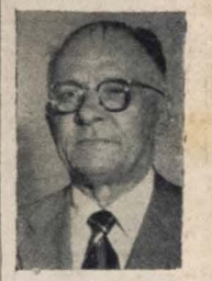
Senador Virgínio Veloso Borges

Encontra-se, desde ontem, em João Pessoa, o Senador Virgínio Veloso Borges, figura de alta expressão dos nossos meios políticos, sociais e econômicos.