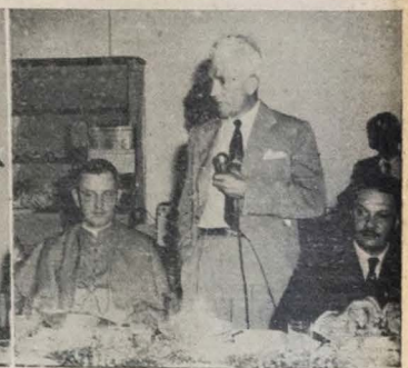
Flagrantes apanhados por ocasião da visita do jornalista Assis Chateaubriand a Campina Grande, onde o ilustre paraibano inaugurou o novo transmissor de ondas intermediárias da Rádio Borborêma.