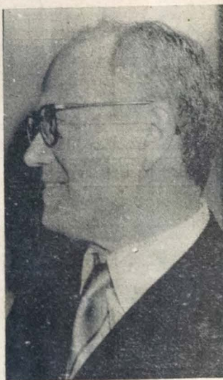
Governador JOSÉ AMÉRICO DE ALMEIDA