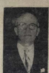
Governador JOSE AMERICO

Chegará, possivelmente ainda hoje, a esta Capital, o Chefe do Governo — Visita a serviços públicos estaduais, em vários municípios — Partiu S. Excia., ontem, de Brejo das Freiras — Visita a Taperóá e outros municípios do Cariri